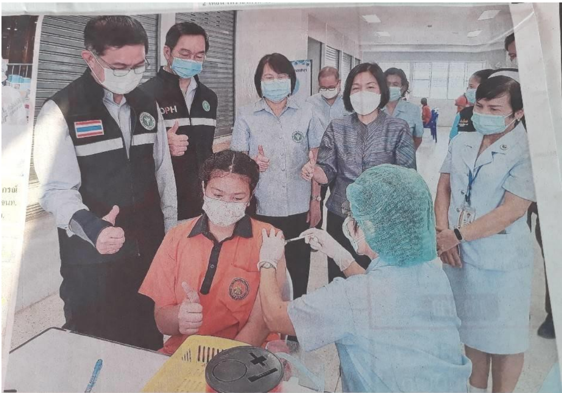
ให้กำลังใจ นพ.อุทธนา วรรณไพฑูริกกลาง นายแพทย์สาธารณสุขจังหวัดพระนครศรีอยุธยา ลงพื้นที่ตรวจเยี่ยมพร้อมให้คำแนะนำและให้กำลังใจบุคลากรทางการแพทย์ รพ.เสนา บริการฉีดวัคซีนไฟเซอร์ให้แก่เด็กนักเรียน อายุ 5-11 ปี ที่มีโรคประจำตัว เพื่อสร้างภูมิคุ้มกันป้องกันโควิด-19 ที่ รพ.เสนาท่ามกลางความดีใจของผู้ปกครองที่เด็กๆได้รับวัคซีนป้องกันโควิด-19.